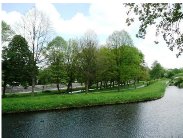
Singel om complex Blijdorp.