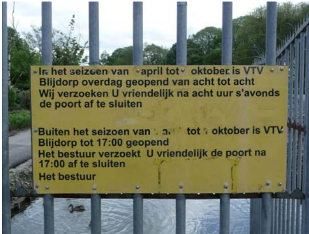
Poort auto-ingang complex Blijdorp.