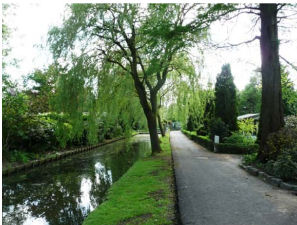
Overzicht complex opgericht 1935.