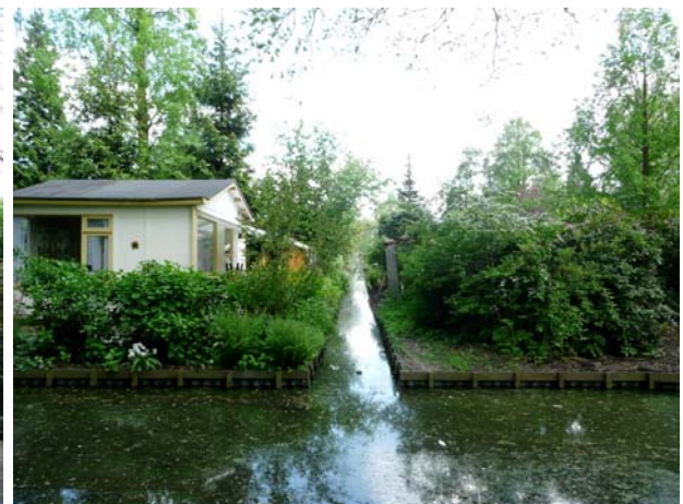
Watergang tussen percelen.