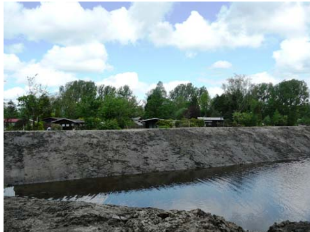
Nieuwe extra watersingel - waterberging.