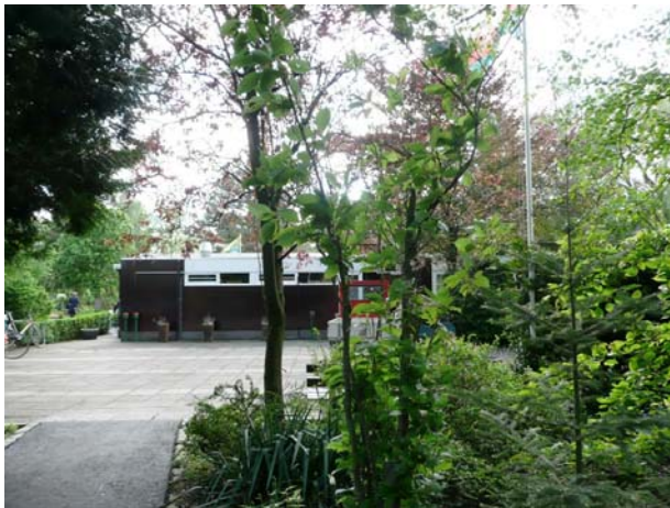
Clubhuis met vergaderruimte, podium en bar.