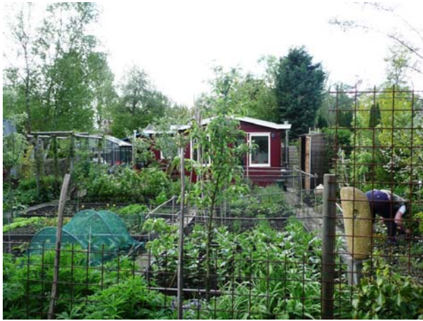
Moestuïn (1 van de weinige)