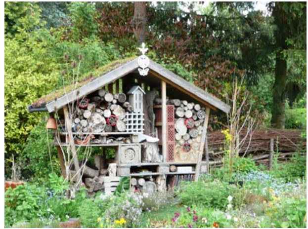
Vlindertuin met huisje voor insecten.