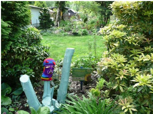
Thematuin voorbeeld - prijswinnaar.