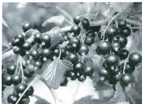
Tsema met grote bessen aan lange trossen

Tenah en Tsema met vroege bloei en vroege rijpheid. Een krachtige groei met uithangende takken. Grote bessen aan lange trossen met veel bessen per tros. Beide rassen hebben een goede smaak, fijn aroma en bevatten een hoog gehalte aan vitamine C