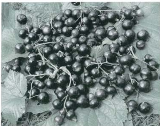
Vruchten van de zwarte bes

De zwarte bes behoort evenals de rode bes en de kruisbes tot het geslacht Ribes en wel tot de soort Ribes nigrum. Deze soort is inheems in grote delen van Europa en is in de 16e eeuw in cultuur genomen. Nadien is het verspreidingsgebied door verwildering nog uitgebreid. Uit de gemengde knoppen ontstaan evenals bij de rode bes trossen, die afhankelijk van het ras, kort of lang kunnen zijn. De vroegbloeiende rassen hebben meer kans op schade door nachtvorst dan de rassen die laat bloeien. Het verschil in bloeitijd tussen de rassen is ongeveer twee weken.