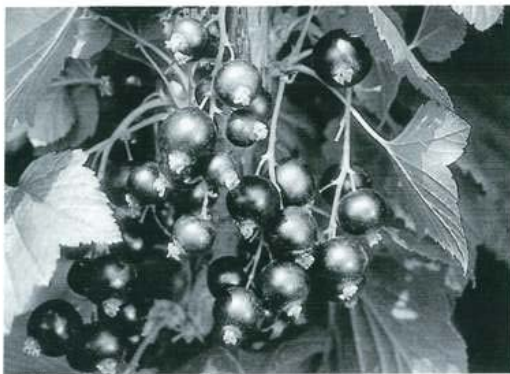
Triton met grote stevige bessen aan lange trossen

Triton is eveneens een vroeg rijpend ras met een tamelijk vroege bloei. De groei is sterk met stevige takken en vormt een brede struik. De grote bessen groeien aan lange trossen, hebben een stevige vruchtschil en een redelijk goede smaak.