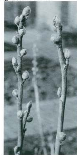
aantasting door rondknopmijt

Hierin zitten grote aantallen mijten, larven en eieren. De knoppen lopen niet uit of geven misvormde bladeren. In het voorjaar verspreiden de mijten zich over de takken om later nieuwe knoppen te bezetten.