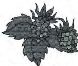
frambozen zijn enorm gezond

Bij onderzoek in het Plant Research International werden alle gezondheidsbevorderende eigenschappen van frambozen op een rijtje gezet. Zo blijkt de vrucht onder meer een geneeskrachtige stof te bevatten, die in die hoeveelheid tot nu toe in geen enkel ander voedingsmiddel is gevonden. Frambozen bevatten naast de geneeskrachtige